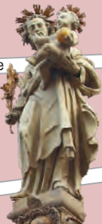
Figur am Haus Fleck