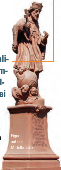
Figur auf der Mittelbrücke

Überaus repräsentativ beherrscht die 1732 errichtete ehemalige Domkapitelfaktorei