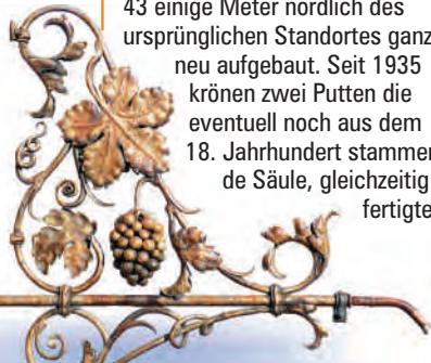
Ausgussrohr am Hospitalbrunnen

Der Brunnenstandort am Hospital ist bereits für das Jahr 1526 nachzuweisen. Der 1711 mit einer Säule und krönender Kugel erneuerte Brunnen wurde 1842/43 einige Meter nördlich des ursprünglichen Standortes ganz neu aufgebaut. Seit 1935 krönen zwei Putten die eventuell noch aus dem 18. Jahrhundert stammende Säule, gleichzeitig fertigte