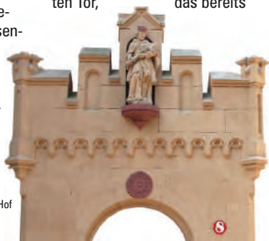
Portal am Hohenecker Hof

Das Kirchenschiff wurde wohl über das ausgehende Mittelalter hinaus als Raum zur Armen-, Alten- und Krankenpflege genutzt.