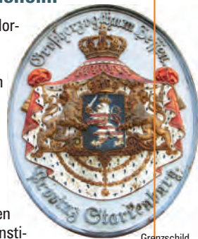
Grenzschilde am Museum

Das nach Norden eingeschossige, nach Süden zweigeschossige traufständige Museumsgebäude geht wohl auf den Rest des einstigen Lorscher Klosterhofes zurück. Die südliche Fachwerkwand über dem wahrscheinlich älteren, massiven