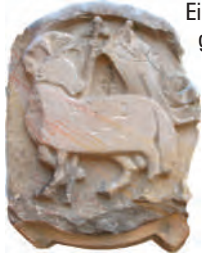
Spolie an der Fassade

Ältester Teil des Dalberger Hofes dürfte der 1587 erbaute Turm mit einer geschweiften Haube aus